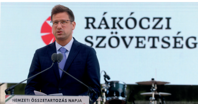
■ Gulyás Gergely Miniszterelnökséget vezető miniszter beszéde a Nemzeti Összetartozás Napja alkalmából, a Rákóczi Szövetség megemlékezésén Sátoraljaújhelyen 2023. június 4-én

„Az élethépes nemzetekre a katasztrófa úgy hat, mintha visszavágják a fát. Annál erősebben hajt.” 1