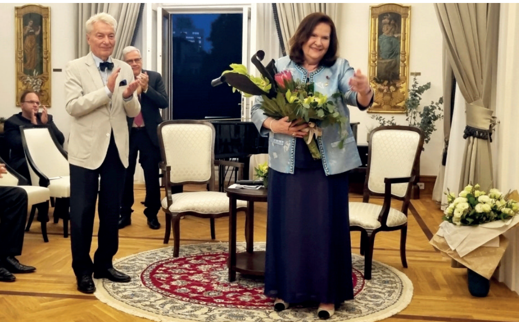
■ Prof. Dr. Vizi E. Szilveszter elnök köszönti Marton Éva alelnököt a Corvin-lánc Testület estjén 2023. június 16-án

Szerencsés hazánk, hogy Marton Éva, a világ legkiemelkedőbb drámai szopránjainak egyike itt született, aki miután meghódította és több mint 30 éven át a csúcson uralta a világ legnagyobb operaházainak színpadait, hazatért, hogy nagy szeretettel átadja kivételes tudását és tapasztalatait.