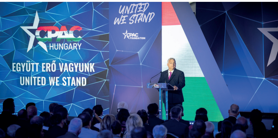
Orbán Viktor miniszterelnök, az esemény főszónoka a CPAC Hungary fórum első napján a Bálna Budapestben

Május 4–5-én Budapesten került megrendezésre a jobboldal egyik legnagyobb nemzetközi tanácskozása, a Konzervatív Politikai Akció Konferencia (CPAC). A konferenciát 1974-ben az American Conservative Union és a Young Americans for Freedom alapította, mára a CPAC (Conservative Political Action Conference), a konzervatívok legbefolyásosabb összejövetele a világon, több száz konzervatív szervezetet, több ezer aktivistát, több millió nézőt és a világ legjelentősebb vezetőit tömöríti. Megtiszeltetés, hogy már az első európai fórumnak is Budapest adhatott otthont a tavalyi évben – mondta a szervező Alapjogokért Központ főigazgatója Szánthó Miklós. Az alábbiakban a CPAC Hungary főszónokának, Orbán Viktornek, Magyarország miniszterelnökének beszédéből idézünk részleteket.