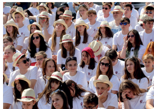
■ A Rákóczi Szövetség fiataljai