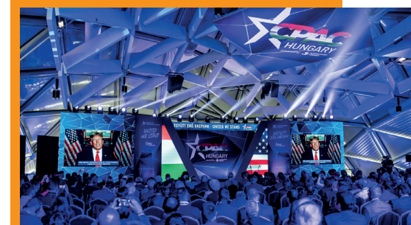
Donald J. Trump az USA 45. elnöke videó-üzenetben köszöntötte a második nap résztvevőit