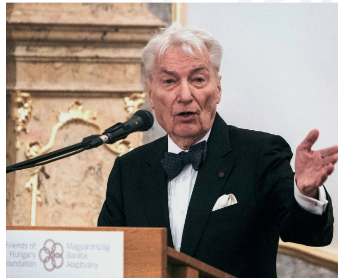
■ Prof. Dr. Vizi E. Szilveszter MOBA elnök köszöntője

A konferencia Fővendége Prof. Dr. Sulyok Tamás, az Alkotmánybíróság elnöke –, aki egyben a kötet értékes zárszavának szerzője – „Mit üzen az Aranybulla a 21. század alkotmánybíráinak?” című előadásában felidézte a magyar alkotmányosság fejlődését. „Az elmúlt 800 évben megszülettek olyan, ma már magától értetődő fogalmak, mint a nemzet, az állami önkormányzat, a demokratikus hatalomgyakorlás vagy éppen a jogállamiság.” Napjainkban az Alaptörvény biztosítja azokat az alapvető jogokat, amelyekre az állami hatalomgyakorlással szemben apellálhatunk. Amikor a konferenciára készülve megkérdeztem kollégáim, mit üzen az Aranybulla a 21. század alkotmánybíráinak, és miben látják az alkotmánybírási munka lényegét: „számomra is meglepő módon minden megkérdezett munkatársam ugyanazt mondta: