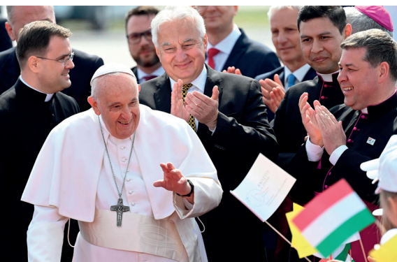
■ Ferenc pápa érkezése a Liszt Ferenc-repülőtérre, mögötte Semjén Zsolt miniszterelnök-helyettes

A Szentatyá 2023. április 28-30. között ország-látogatáson járt hazánkban, ám apostoli útjának helyszínei életkora miatt, Budapestre korlátozódtak. A Szentszék kapcsolata Magyarországgal több mint ezer éves, a modern diplomáciai vonatkozások századik évfordulóját 2020-ban ünnepeltük. Ferenc pápa két évvel ezelőtt, az 52. Nemzetközi Eucharisztikus Kongresszus zárónapján járt először Magyarországon, amelyről magazinunk 2021. téli számában olvashattak.