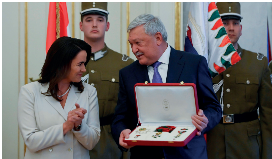
■ Dr. Csányi Sándor az OTP Bank Nyrt. elnök-vezérigazgatója átveszi a Magyar Szent István Rend kitüntetését Novák Katalin köztársasági elnöktől.

Tisztelettel gratulálunk Dr. Csányi Sándornak, az OTP Bank Nyrt. elnök-vezérigazgatójának, aki Magyarország legmagasabb állami kitüntetését, a Magyar Szent István Rendet vehette át Novák Katalin köztársasági elnöktől 2023. március 31-én, a Sándor Palotában. Orbán Viktor miniszterelnök előterjesztésére, Magyarország jó hírnevét erősítő, kivételesen sokoldalú életműve, a magyar gazdaság versenyképességét szolgáló, stabil bankrendszer kialakításában és fejlesztésében betöltött meghatározó szerepe, a közép-európai régió egyik legkiemelkedőbb magyar vállalatvezetőjeként elért sikerei, a nemzeti értékek és érdekek iránti elkötelezettsége, a magyar kultúra, oktatás és sport, valamint a tehetséggondozás támogatásában is példaadó életútja elismeréseként tüntette ki Csányi Sándort az Államfő.