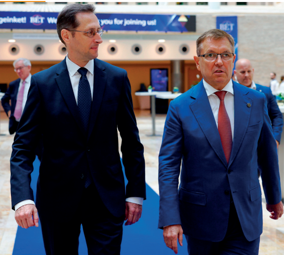
■ Varga Mihály pénzügyminiszter (b) és Matolcsy György, a Magyar Nemzeti Bank (MNB) elnöke a Magyar Nemzeti Bank Budai Központjában 2023. június 21-én

Az utóbbi évtized során a magyar gazdaság pozitív rekordok egész sorát állította fel. A pandémia kitöréséig jelentősen javultak a makromutatók, a Kormány a veszélyes nemzetközi környezetben is folytatja az egyensúlyi mutatók javítását, garantálja az ország biztonságát, megvédi a családokat, a nyugdíjakat, a munkahelyeket, és a rezsi-csökkenést.