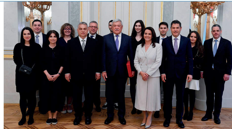
■ Dr. Csányi Sándor, az OTP Bank elnök-vezérigazgatója, (középen) Novák Katalin köztársasági elnök (j5), Orbán Viktor miniszterelnök (b5), valamint a Kitüntetett hozzátartozói az elismerés átadásán a Sándor-palotában 2023. március 31-én