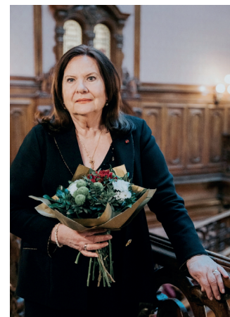
■ Marton Éva világhírű operaénekes, a MOBA egyik Alapítója

A konferencia ünnepi pillanata volt Marton Éva világhírű operaénekes köszöntése, akit a Magyarország Barátai Alapítvány tisztelettel tudhat Alapítói között. Egyedülálló pályafutása során Ő volt minden idők leghíresebb megformálója Merániai Gertrudis alakjának, az Aranybulla kibocsátó II. András király feleségének, Erkel Ferenc „Bánk bán” című operájában. 2002-ben Káel Csaba rendezésében fimadaptáció készült az operából, amelyet az Oscar-díjas Zsigmond Vilmos fényképezett.