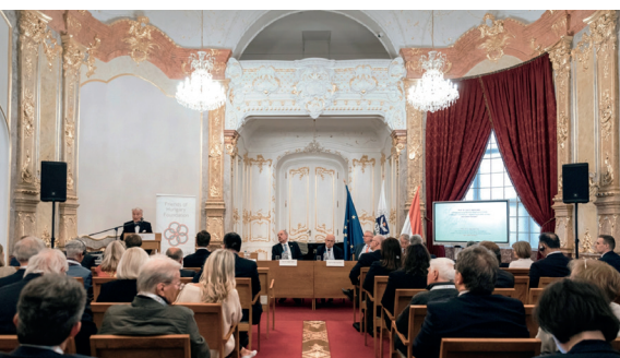
■ A Károlyi-Csekonics-palota bálterme, a konferencia helyszíne

Prof. Dr. Vizi E. Szilveszter a Magyarország Barátai alapítvány elnöke, a Magyar Tudományos Akadémia korábbi elnöke „Quo Vadis Európa?” címmel tartott kiváló nyitó előadást.