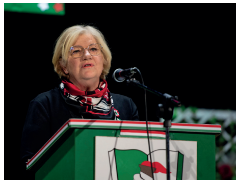
■ Dr. Szili Katalin miniszterelnöki főtanácsadó beszéde Szlovákiában, Érsekújváron a 2024. március 15-i megemlékezésen

Dr. Szili Katalin korábbi Házelnök, a Miniszterelnök jelenlegi Főtanácsadója, mindig nemzetünkért dolgozik. Az autonómia, a kívül rekedtek érdekeinek ad hangot a Kárpát-medencében és a diaszpórában. Keresztény indíttatású politikus, idén májusban lesz 30 esztendeje, hogy a magas politikába bekerült. Egy fél élet – ahogy Ő fogalmaz. 1994-ben neveztek ki a Környezetvédelmi és Vízügyi Minisztérium politikai államtitkárává, mely posztot 1998-ig töltötte be, amikor az Országgyűlés alelnökévé választották. 2002–2009 között a rendszerváltás utáni Magyar Köztársaság első női Házelnöke volt. Az Országgyűlés elnökeként kiegyensúlyozott kapcsolatokat alakított más országok házelnökeivel, ami hazánk számára meghatározó volt. Ahogy egy interjúban 1 visszaemlékezett, a személyes jó kapcsolatok, a köz számára is jó lehetőséget biztosítottak a pozitív cselekedetekhez. Nemzeti ünnepeinkről szólva elmondta, a magyarság mindenütt, akár a Kárpát-medencében, akár a diaszpórában él, azokról megemlékezik.