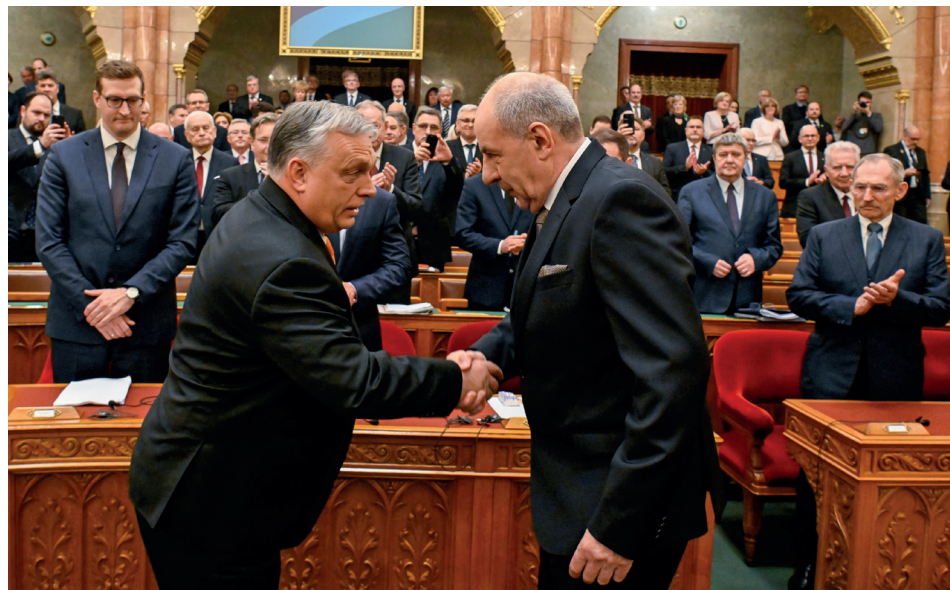
Orbán Viktor Magyarország miniszterelnöke gratulál Sulyok Tamás köztársasági elnöké választásához a Parlamentben 2024. február 26-án

Magyarország köztársasági elnöke – az öt legfőbb közjogi méltóság közül az első –, kifejezi a nemzet egységét és örökdió az államszervezet demokratikus működése felett. Ő a Magyar Honvédség főparancsnoka. 2024. március 5. óta Magyarország köztársasági elnöke Prof. Dr. Sulyok Tamás . A tavaszi ülés első napján, február 26-án az Országgyűlés választotta őt köztársasági elnöké, miután Novák Katalin kegyelmi ügy miatti lemondásával megüresedett az államfői szék. 147 képviselő vett részt a szavazáson, 134-en támogatták, hogy az Alkotmánybíróság elnöke legyen az új államfő. A szavazás után Sulyok Tamás ünnepélyes hivatali esküt tett, majd fogadta Orbán Viktor Magyarország miniszterelnökének, Kövér László házelnöknek, a kormánypárti és a jelenlévő ellenzéki frakcióvezetőknek a gratulációját.