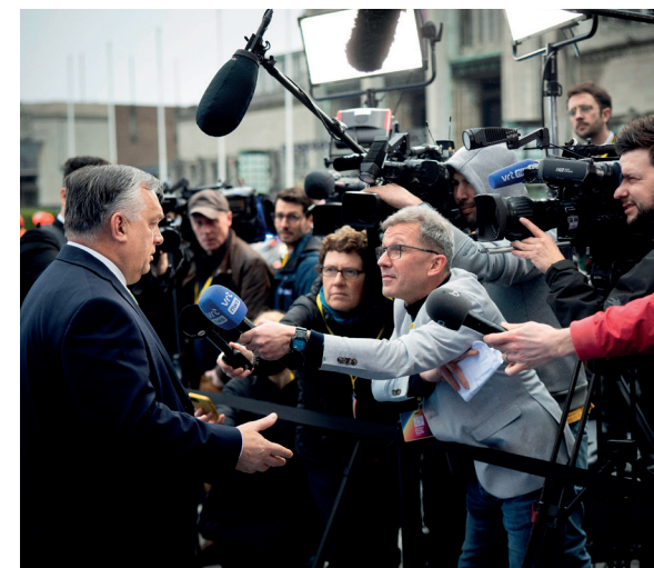
Orbán Viktor Magyarország miniszterelnöke Brüsszelben

Az 1848–1849-es szabadságharc egyik parancsnokát idézte, aki amikor teljesen bekerítették őket, azt mondta: ez a legjobb hír, akkor minden irányban támadhatunk. Ez a B-terv! ■