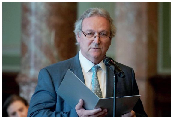
■ Prof. Dr. Freund Tamás a Magyar Tudományos Akadémia jelenlegi elnöke

A jövőre 200 éves Magyar Tudományos Akadémia nemcsak a tudomány temploma, hanem exkluzív helyszín a művészetek és az ünnepnapok számára is. Prof. Dr. Vizi E. Szilveszter , az MTA korábbi elnöke (2002–2008 között két cikluson át), az Akadémiai Klub Egyesület elnöke vallja, hogy a kultúra, a tudomány és a művészet egységének megteremtése és terjesztése az MTA egyik fontos feladata. A hagyományok méltó ápolása mellett pedig cél a hagyományteremtés is. Ezért Prof. Dr. Freund Tamással , az Akadémia jelenlegi elnökével közösen létrehozta egy hagyományteremtőnek szánt rendezvénysorozat „Művészeti Estek az Akadémián” címmel. Az MTA az Akadémiai Klub Egyesülettel, valamint társszervezőkkel, mint például a Széchenyi Irodalmi és Művészeti Akadémia, Magyar Művészeti Akadémia, 2021 szeptemberében indította útjára a művészeti esteket, amelyek rendszeresen jelentkeznek; a magyar zeneművészet, képzőművészet és a gasztronómia művészetének kiválóságait összekapcsolva és bemutatva a meghívottak számára.