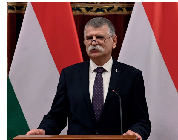
■ Dr. Kövér László az Országgyűlés elnöke a Parlamentben

„A diaszpórában élők fontos szerepet töltenek be egy nemzet életében, hiszen általuk kap képet a világ arról, hogy kik is vagyunk mi, magyarok. Ők képviselik nemzetünket a világban. De legalább ennyire fontos, hogy minden magyar, éljen a világ bármely pontján, itthon érezze magát Magyarországon és tudja, hogy bármikor hazatérhet. Ennek kapcsán új lehetőséget jelentenek a diaszpórából ideiglenesen, vagy véglegesen hazaérkezők számára a Hazaváró Irodák” – mondta Kövér László házelnök. ■