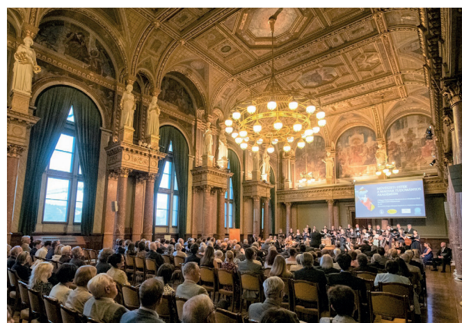
■ „Művészeti Estek az Akadémián” közönsége a Díszteremben

Az estéken a dísztermi koncerteket vernissage, kiállítás-megnyitó követi, majd fogadás és borkóstoló zárja. Az elmúlt tíz alkalommal a legkiválóbb magyar művészek léptek fel, mint Miklósa Erika Szent István Renddel kitüntetett, Kossuth-, Liszt Ferenc- és Prima Primissima díjas koloratűrszoprán,