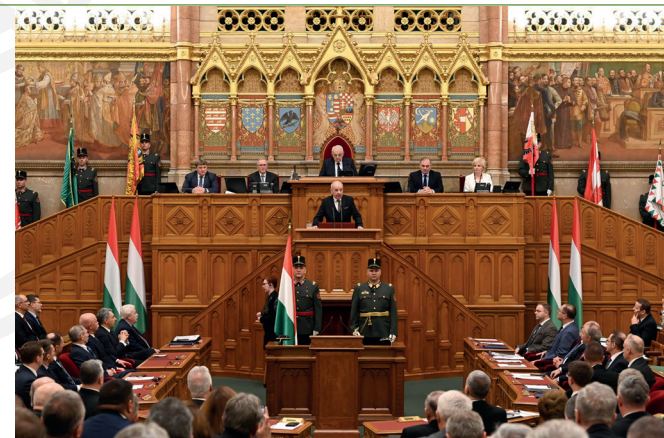
Sulyok Tamás beszéde az Országgyűlés plenáris ülésén 2024. február 26-án

S ulyok Tamás ünnepélyes beiktatási ceremóniájára március 10-én került sor a Szent György téren, ahol a történelmi zászlók bevonulása után, a történelmi egyházak adták áldásukat. Hivatalba lépésének napján (március 5.) első intézkedésként aláírta a Svédország NATO-csatlakozásáról hozott parlamenti döntést.