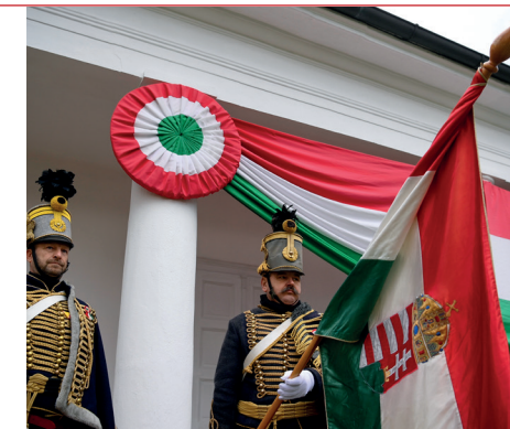
■ Orbán Viktor miniszterelnök az állami díszünnepségen a Múzeumkertben 2024. március 15-én. (b); Hagyományörző huszárok a tiszafüredi ünnepségen (középen); Katonai tiszteletadással felvonják a nemzeti lobogót az Országház előtt (lent)