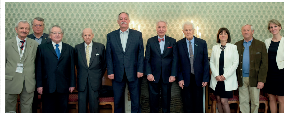
■ A Magyarország Barátai Alapítvány Alapítóinak, Kuratóriumának és vezetésének találkozója 2017-ben.