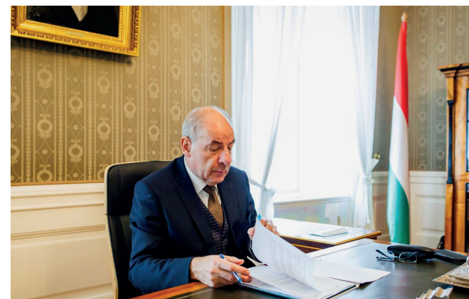
2024. március 5. Sulyok Tamás köztársasági elnök hivatalba lépésének napján ellenjegyzti a Parlament döntését Svédország NATO-csatlakozásáról

Első hivatalos útja munkalátogatás volt Lengyelországba, ahol Andrzej Duda köztársasági elnökkel találkozott a lengyel–magyar barátság napja (március 23.) alkalmából. Alaptörvényi köteletségének eleget téve kitzte az Európai Parlament magyarországi képviselőinek választását, valamint a helyi önkormányzati képviselők és polgármesterek általános választását. Az első alkalommal egy időben tartandó választásokra június 9-én kerül sor.