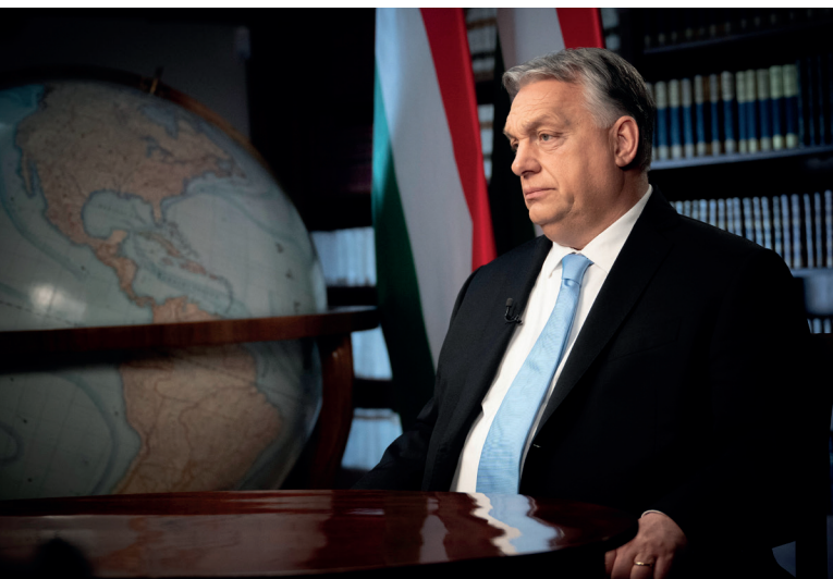
Orbán Viktor Magyarország miniszterelnöke a Karmelita Kolostorban

Orbán Viktor, Magyarország miniszterelnökének két nagy jelentőségű beszédéből, a 25. évértékelőből (amelyet tizenhét ország miniszterelnökeként tartott), valamint a Magyar Kereskedelmi és Iparkamara évnitiján mondottakból készítettünk Önöknek egységgé alakított összefoglalót. 1,2